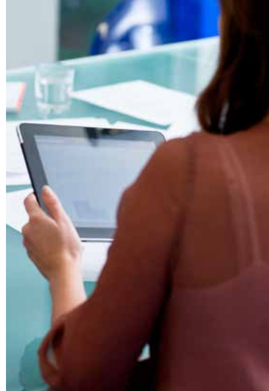
Abbildung 1. Alcatel-Lucent OpenTouch™ Suite für KMU - Angebotsübersicht

Das Portfolio ist zuverlässig, offen und basiert auf Standards. Die Alcatel-Lucent OpenTouch™ Suite für KMU ist auf allen Ebenen modular – von Kommunikationspaketen und Softwarelizenzen bis hin zu Kommunikations-Servern und Netz-Infrastrukturen, die genau auf die Anforderungen der Kunden abgestimmt sind. Sie können dieses Portfolio mit einer Hardwaregarantie und zahlreichen Leistungen erwerben: vom einfachen Wartungsvertrag bis zur kompletten Systemausrüstung für neue Anwendungen und Technologien. Die Alcatel-Lucent OpenTouch™ Suite für KMU ist zukunftsorientiert, basiert auf der OmniPCX™ Office Rich Communication Edition (RCE) – einem leistungsstarken und flexiblen IP-Kommunikations-Server mit Standardprotokollen – und bietet eine Reihe leistungsfähiger Merkmale.