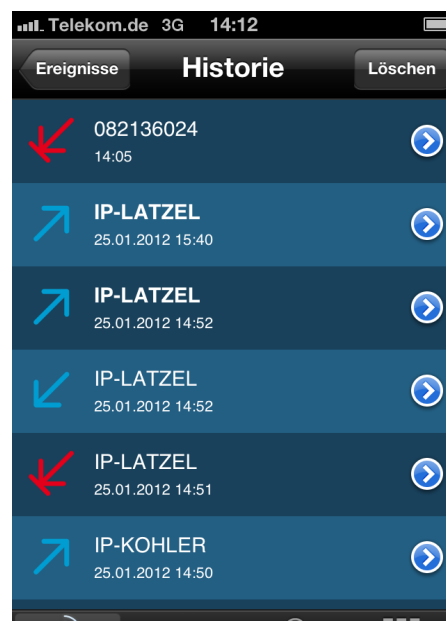
Screenshot von My IC Mobile für iPhone

(*) Siehe "White List" der Geräte auf dem Alcatel-Lucent Business Partner-Portal